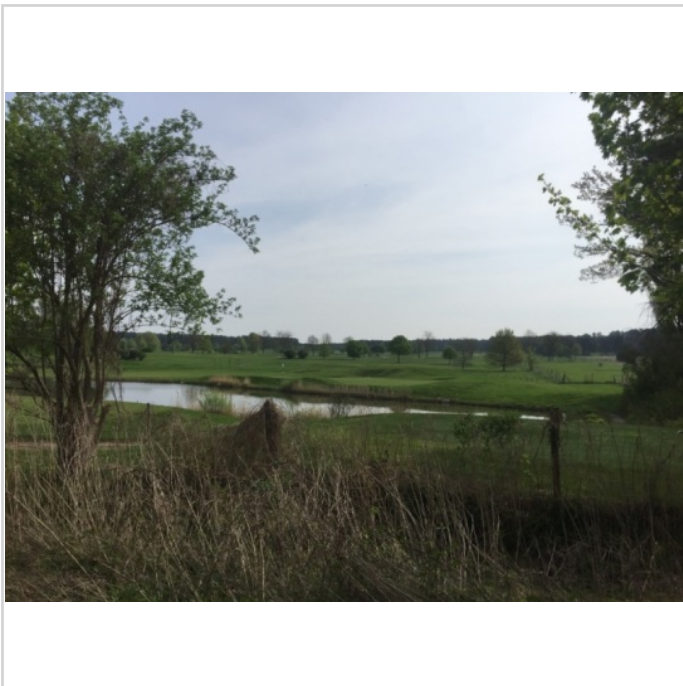
Blick auf Golfplatz Motzen

Zimmer: 5,00 Wohnfläche ca.: 133,53 m 2 Kaufpreis: 249.000,00 EUR